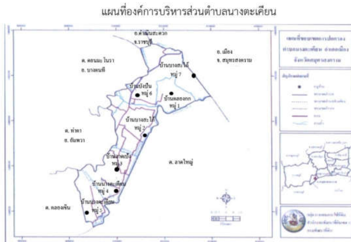
แผนที่ตำบลนางตะเคียน อำเภอเมือง จังหวัดสมุทรสงคราม

ขนาดพื้นที่ ๑๖.๖๙๙๒ ตารางกิโลเมตร ( ๑๐,๔๓๗ ไร่ )